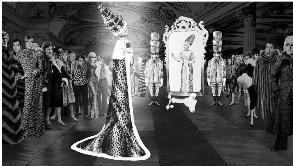
La reine veut être la plus à la mode du royaume de la mode

Itinérances aime le format court. La Fête du court métrage, du 25 au 31 mars, est une nouvelle occasion de le célébrer. Deux programmes sont projetés cette année, Bien dans ma tête et Trouver sa place . Ce dernier regroupe trois films autour de la question « Vous est-il déjà arrivé de vous sentir en décalage, dénigré-e, seul-e parmi les autres ? ». Ils abordent cette thématique avec originalité, explorant les sujets de la puberté, du sport à l'école et de la fast fashion. Dans À mort le bikini ! , de Justine Gauthier, le cadre est très souvent chamboulé. Les plans à la GoPro et le surcadrage (un cadre dans un cadre) appuient la vivacité